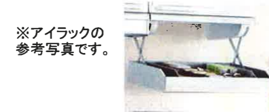
※アイラックの参考写真です。