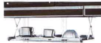
※水切りラックの参考写真です。

カビもつきにくいのでお掃除もラクラク★タイルもデッキブラシでゴシゴシ磨くことが出来るので腰を落とさずお掃除が出来ます！お色もキレイなピンクをお選び頂きました。ホワイトやブラックなどもございます。