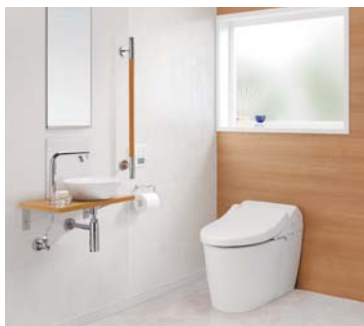
※写真はネオレストRH